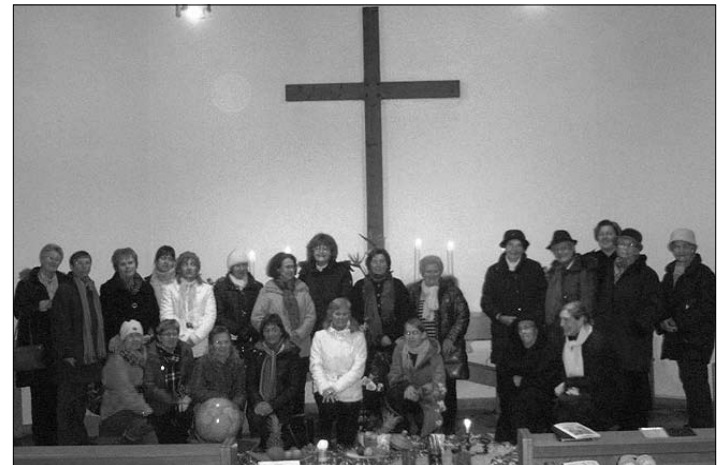
Foto vom ökumenischen Weltgebetstag der Frauen in der evangelischen Christuskirche