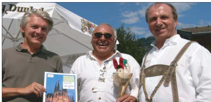
Übergabe des von EUROTOURS gestifteten Hauptpreises