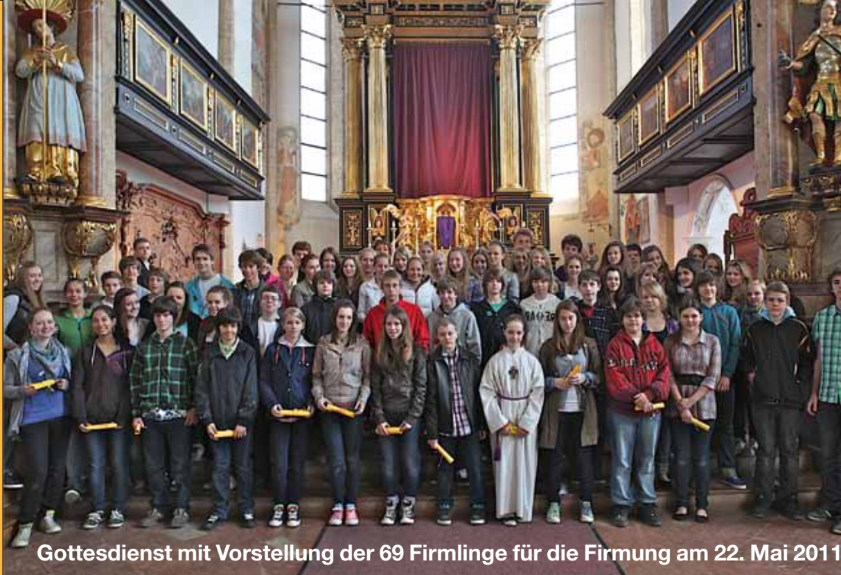
Gottesdienst mit Vorstellung der 69 Firmlinge für die Firmung am 22. Mai 2011